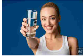
Il gusto conta tanto quanto la dimensione