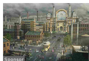
Il gioco Vintage "da giocare". Nessuna...