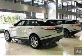
Milan: Liquidazione dei SUV 2020 invenduti