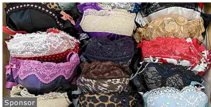
Addio reggiseno tradizionale: ecco il reggiseno comodo più venduto dell'anno