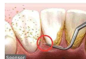
Ecco il facile rimedio al tartaro per evitare la...