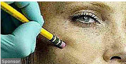
Medici sconvolti dal nuovo metodo per sbarazzarsi delle rughe