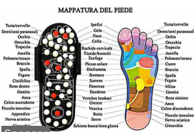
Mal di schiena, stress e stanchezza? Un...