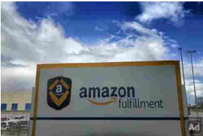
Lavora con Amazon da casa e guadagna 1.500 € al mese. Scopri come