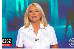
Scomparso 8 anni fa a Roma, ritrovato a Genova mentre chiede l'elemosina ...