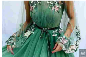
Vendita di abiti della collezione estiva 2021 ai migliori prezzi