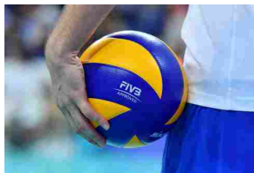
Volley, mercato Lube: colpo Bottolo per i campioni d'Italia