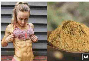
Un cucchiaino a stomaco vuoto brucia 4 kg in una settimana