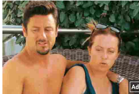
Nessuno sapeva questo segreto di Giorgia Meloni