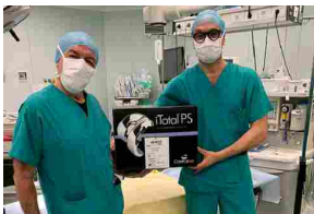
Ortopedia, Ancona: a Villa Igea impiantate le prime 4 protesi totali di