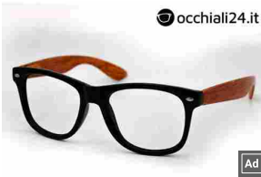
Paghi la montatura e le lenti progressive sono gratuite